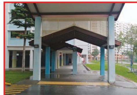
Improved Linkway between Blk 743 & 751 Jurong West Street 73