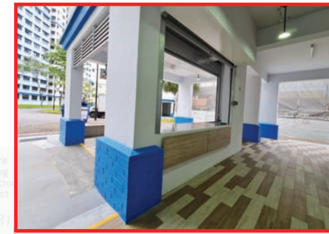
New Resident's Corner at Blk 274B Jurong West Street 25