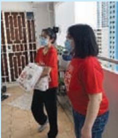
Hampers With a Heart Initiative for Seniors & Financially Challenged Families