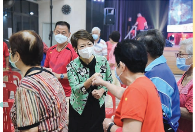
2022 New Year Celebration