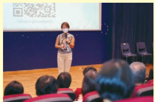
CPF & Your Retirement Needs Dialogue