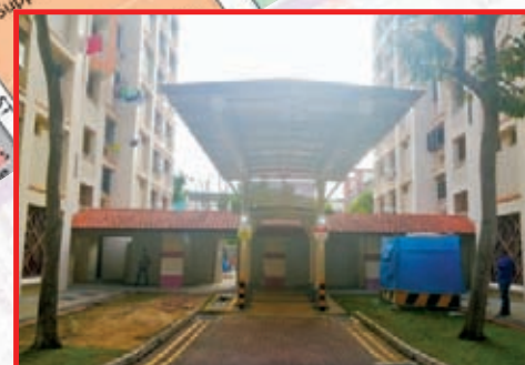
Upgraded Drop-off Porch between Blk 732 & 733 Jurong West Street 73