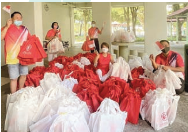
National Day Festive Pack Distribution