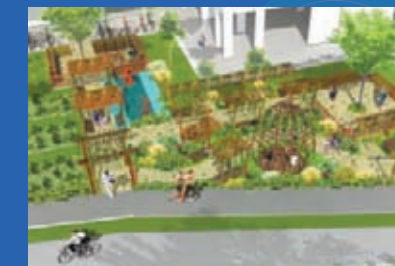
Construction of New Therapeutic Garden Location: Between Blk 732 & 733 Jurong West Street 73 Estimated Completion: 1st Quarter 2023

Electrical Rewiring Works Location: Blk 743 - 751 Jurong West Street 75 Estimated Completion: 3rd Quarter 2023