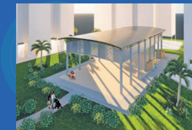
Upgrading of Communal Hall Location: Blk 275 Jurong West Street 25 Estimated Completion: 4th Quarter 2022