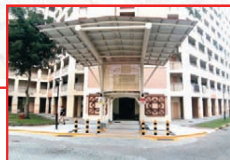
Upgraded Drop-off Porch at Blk 739 Jurong West Street 73