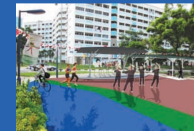
Upgrading of Open Plaza Location: Near Blk 732 Jurong West Street 73 Estimated Completion: 3rd Quarter 2022