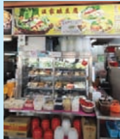
WeSupport @Gek Poh to encourage shopping at Local Businesses