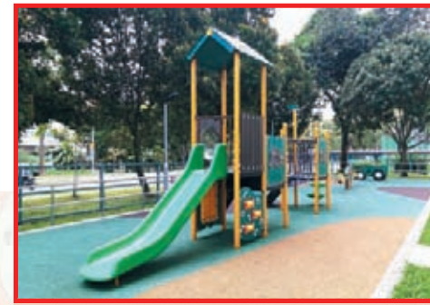
Upgraded Playground near Blk 275A Jurong West Street 25