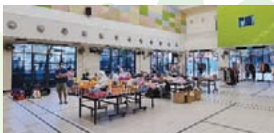
Pre-loved Clothing Recycling and Upcycling Programme