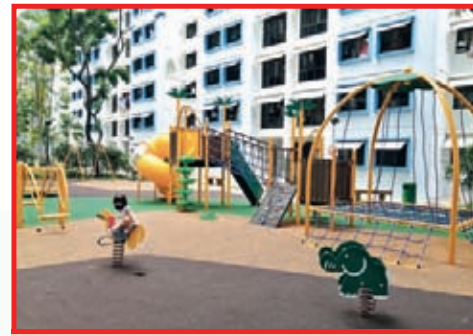
Upgraded Playground near Blk 272C Jurong West Street 24