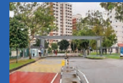
New High / Low Covered Linkway Location: Blk 743 Jurong West Street 73 - Westwood Primary School Estimated Completion: 3rd Quarter 2023