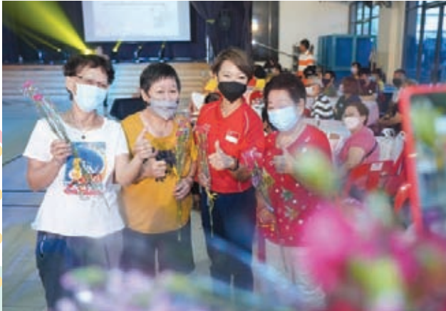
Mother's Day Celebration