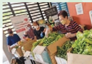
Rescued Vegetable Distribution