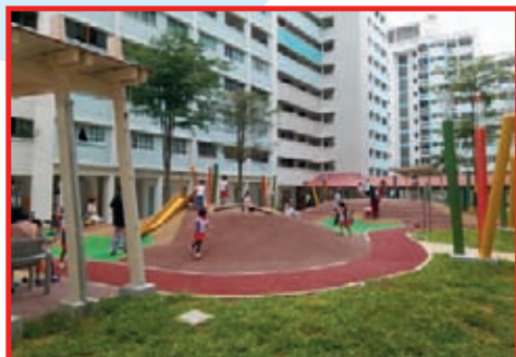
New Playground from Neighbourhood Renewal Programme near Blk 746 Jurong West Street 73