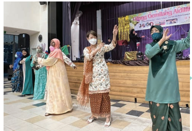
Hari Raya Celebration