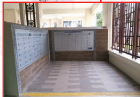
Upgraded Letterboxes under Neighbourhood Renewal Programme at Blks 732-739, 743-751 Jurong West Street 73/75