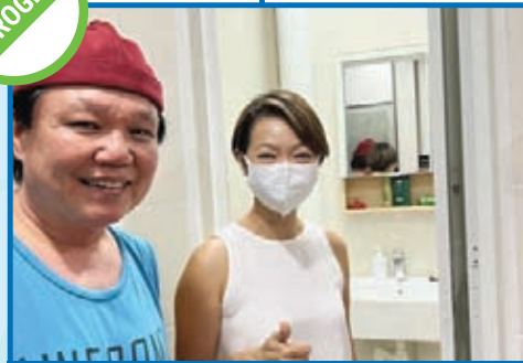
Home Improvement Programme Location: Blk 732-739 Jurong West St 73/75, Blk 743-751 Jurong West St 73 Estimated Completion: 2024