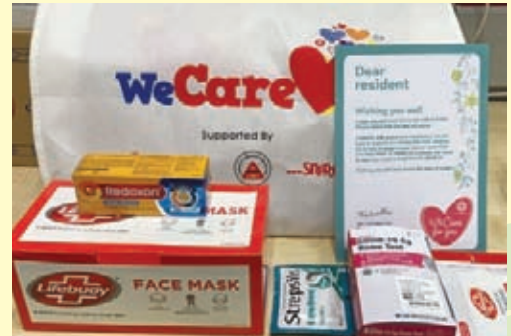
'Here For You' Initiative to support residents under COVID Home Recovery Programme