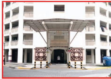
Upgraded Drop-off Porch at Blk 738 Jurong West Street 73

> 5,700 residents benefitted from Electrical Rewiring works at Blk 743 - 761, 764 - 766, Jurong West Street 74