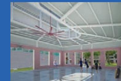
Upgrading of Multi-purpose Hall Location: Blk 739A Jurong West Street 73 Estimated Completion: 3rd Quarter 2022