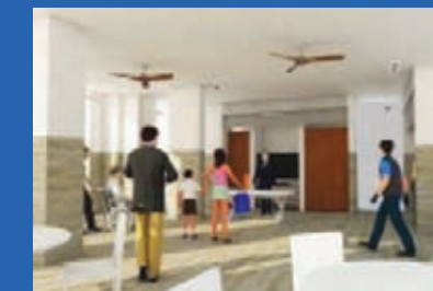
New Cozy Corner Location: Blk 732 Jurong West Street 73 Estimated Completion: 4th Quarter 2022